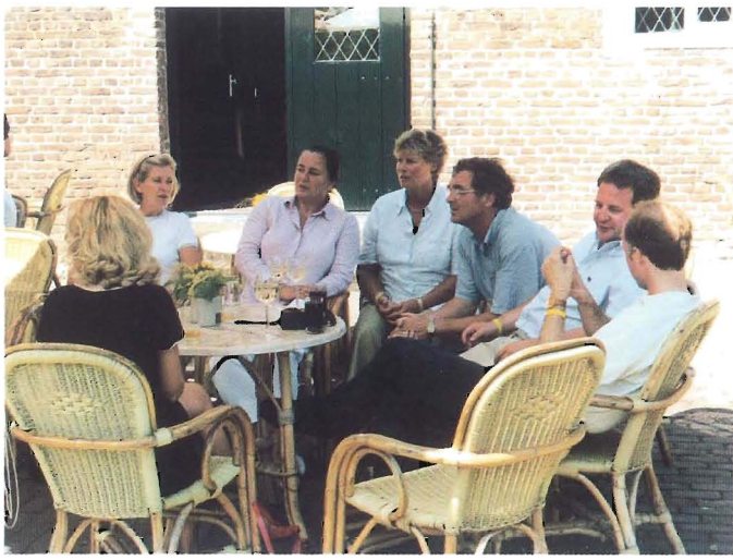
Eindelijk schaduw. Zondagmiddag zochten alle aanwezigen een koele plaats onder de parasol.