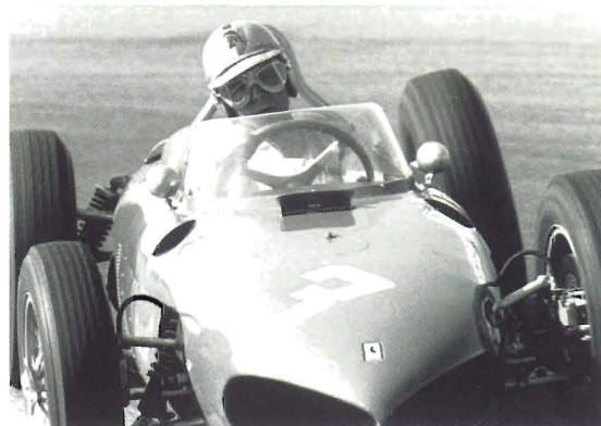
De grootmeester zelf. Wolfgang Graf Berghe von Trips met de Ferrari 156 F1 op weg naar de overwinning in de Grand Prix van Nederland van 1961 op het circuit van Zandvoort.

Wolfgang 'Taffy' von Trips, de racende edelman van slot Hemmersbach bij Kerpen-Horrem, was een echte gentleman, die rijdend voor de Scuderia Ferrari vele successen kende. Het hoogtepunt in zijn carrière had de Italiaanse Grand Prix van 1961 moeten worden. Startend vanaf pole position in de Ferrari 156 F1 (met de beroemde haaienneus) was een mooie uitgangspositie voor zijn eerste wereldtitel. Helaas sloeg reeds in de tweede ronde op Monza het noodlot toe. De Ferrari van Wolfgang, die een matige start wilde goedmaken, kwam op het rechte stuk richting de Parabolica in aanraking met de Lotus van Jim Clark, schoof het talud op, maaide tientallen meters hekwerk neer en kaatste terug op de baan. De onfortuin-